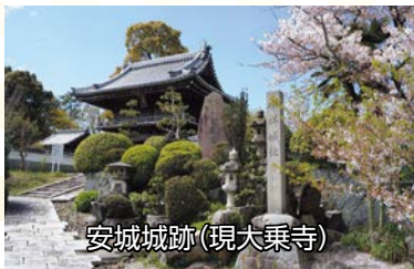
安城城跡(現大乗寺)

安城城が家康の人生と関係するのは、家康の父、広忠の時代です。1540年、尾張の織田信秀(信長の父)が三河へ攻め入り、安城城を奪い取ります(第1次安城合戦)。この戦いで、松平軍は多数の犠牲者を出すとともに、清康が造営した大岡白山神社が焼失したとされます。また、安城コロナワールド前の富士塚は、この時の犠牲者を弔った塚と伝えられます。