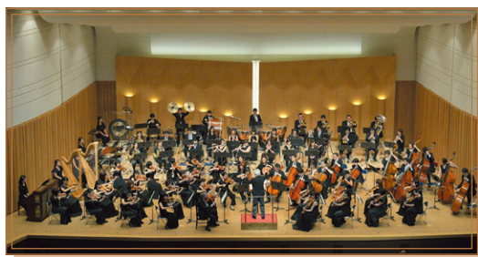
演奏／中部フィルハーモニー交響楽団