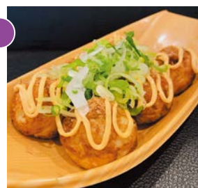
なにわ 浪速のたこ焼き

「手ぶらでみんなでピクニック」がテーマのBBQガー デン。秋空のもと家族みんなでバーベキューを楽しみ ませんか？