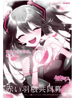
Art by nio © Crypton Future Media,INC. www.piapro.net piapro