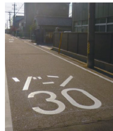
ゾーン30であることを知らせる標識と路面標示