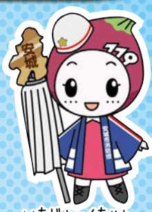
いちじゅーちゃん