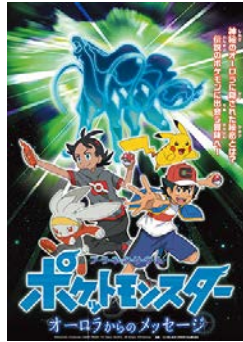
放映番組の1つ、「ポケットモンスター オールスターからのメッセージ」