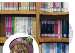
あんず(安城市図書館情報館) @Anjo_Library