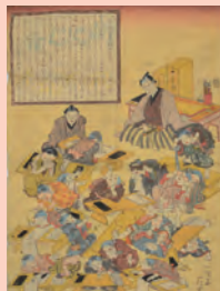
文学万代の宝 始の巻(本館蔵)

今回の展示を通じて、近世後期から現在までの教育に焦点を当て、「勉強の面白さ」を問い直してみます。