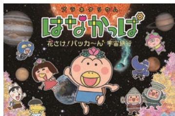
放映番組の1つ、 「はなかくば 花さけ! バッカ〜ん 宇宙旅行」 © 2010 あきやまただし/はなかくばプロジェクト