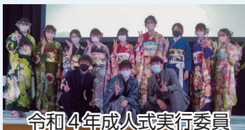
令和4年成人式実行委員