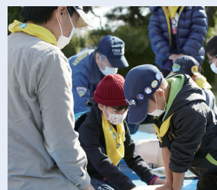
< 昨年の様子 >