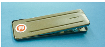
ホームセンター等で購入できる補助錠(窓枠上部内側に貼付)