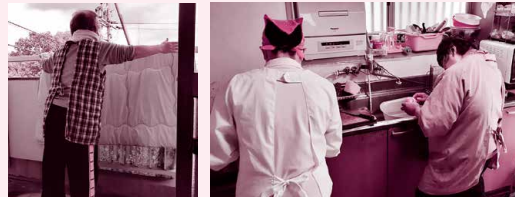
ホームヘルプサービス