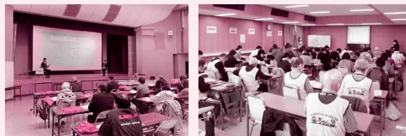
災害ボランティアコーディネーター養成講座