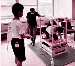
中学生防災隊防災教室