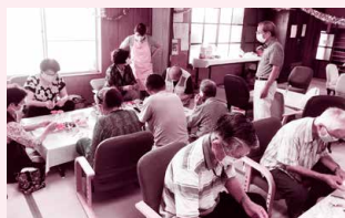
地域交流の場であるサロン活動