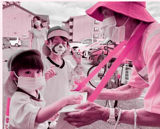
赤い羽根共同募金