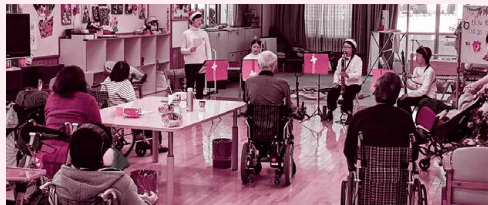
身体障害者デイサービスセンター