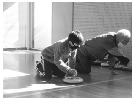
カローリングの様子

時間▶午前9時から午後4時30分まで(カローリングの指導は午前10時から正午まで)