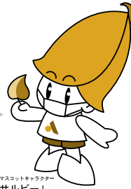
安城市マスコットキャラクター「サルビー」

青少年愛護センターでは、「安城市若者総合相談窓口あんさぽ」を開設し、ひきこもり・不登校など、様々な社会的困難を抱える若者やその家族を対象とした相談支援を行う「若者相談」と、就労を目指す若者を支援する「若年無業者就労支援」を行っています。