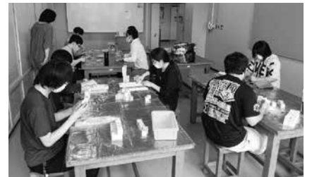
ジョブトレーニングの様子

令和3年度の利用者は、12月末時点で20人でした。そのうち8人が就職し、社会への第一歩を踏み出しました。