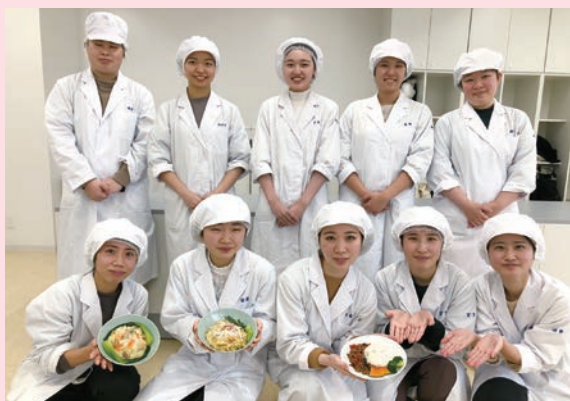
メニューを開発した愛知学泉大学の学生の皆さん