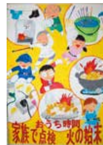
白名優豪さんの作品