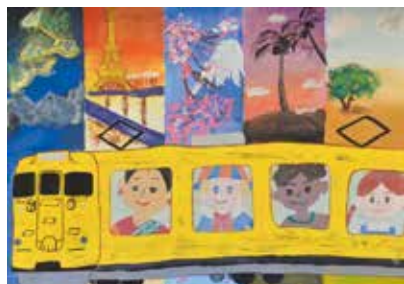
神谷春花さんの作品