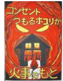
岩瀬聖さんの作品