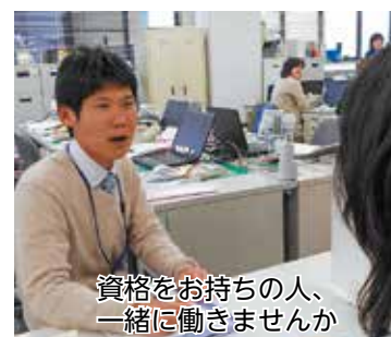
資格をお持ちの人、一緒に働きませんか