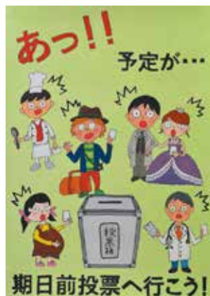
江坂聡悟さんの作品