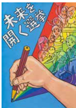
野々山結さんの作品