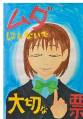
原姫聖さんの作品