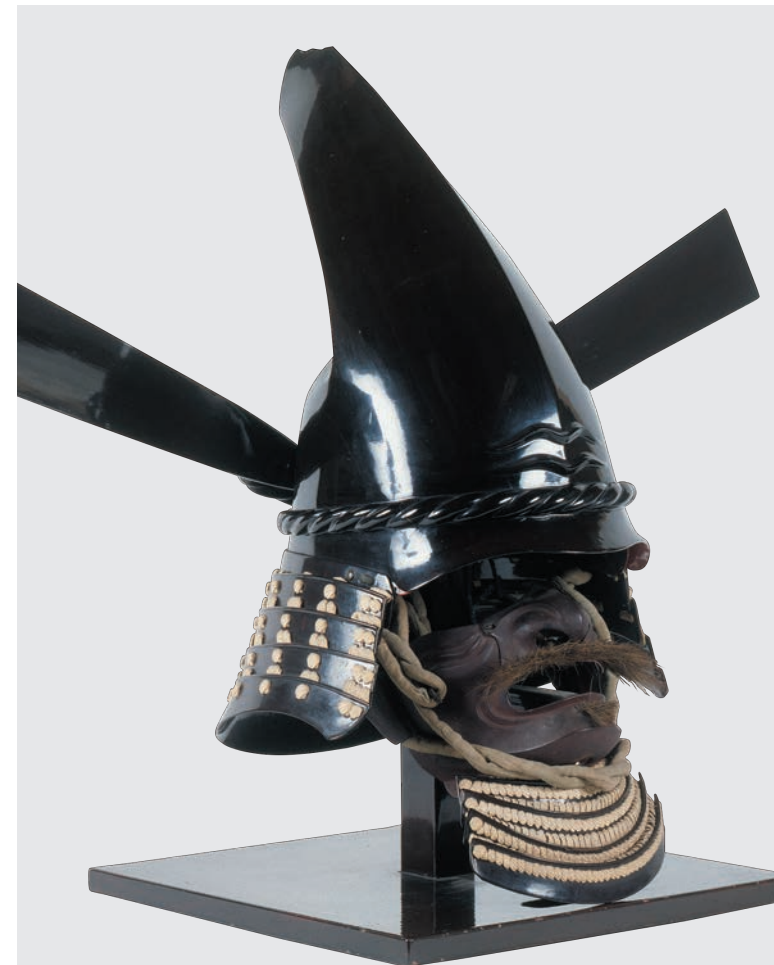
烏帽子形兜(加賀本多博物館蔵)