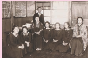
安城高等女学校の教師と女学生(本館蔵)

今回の特別展では、近世から近代にかけて目まぐるしく移り変わる時代の中での女性の「たしなみ」や生活の変化について文書類や生活道具から紹介します。