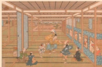
浮絵万歳図(本館蔵)

本展では、本館がこれまで収集・保存してきた三河万歳に関わる資料をあますことなく紹介し、三河万歳の歴史の一端に触れていただきます。