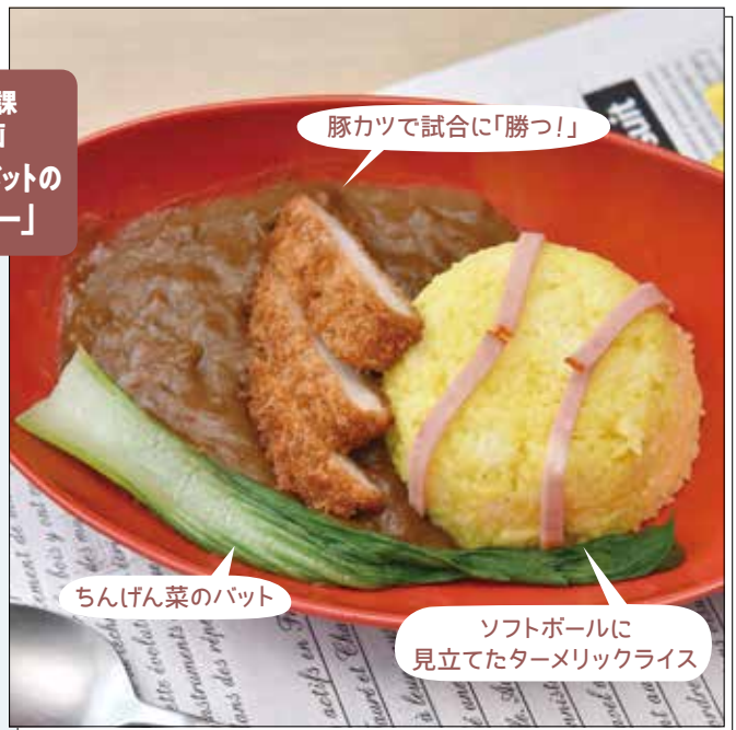
豚カツで試合に「勝つ!」