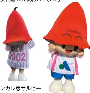
インカレ版サルビー