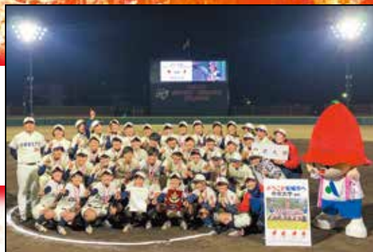
前年度代替大会優勝の中京大学

大学女子ソフトボールの日本一を決める熱い戦いが、「ソフトボールの聖地」安城で開催されます。どなたでも無料で観戦できますので、ぜひ応援にお越しください。会場にはインカレ特別バージョンのサルビーも登場予定！サルビーと一緒に応援しよう！