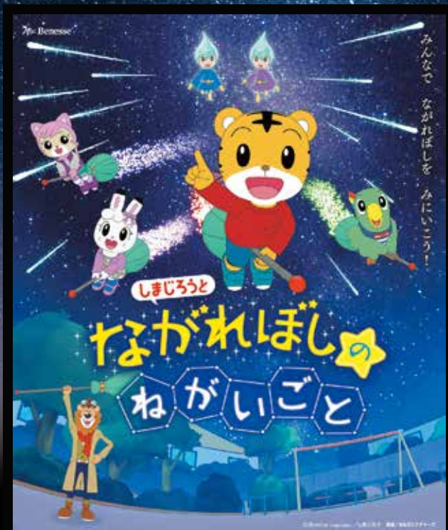
©Benesse Corporation/しまじろう 配給/D&Dピクチャーズ

ガオガオさんと公園に天の川を観察しに来た、しまじろう、みみりん、とりっぴい、にゃっきい。満点の星空に流れ星を見つけて喜ぶ4人。そこに彗星の妖精セセが助けを求めにやってきます。どうやら双子のお兄さんススが小惑星に挟まって困っているようです。彗星は流れ星を見せてくれる大切な存在です。このままでは流れ星が見られません。しまじろうたちは、無事ススを救い、流れ星に願い事をするのはできるのでしょうか？