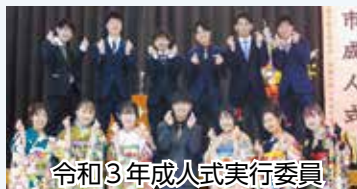
令和3年成人式実行委員

成人式の司会や記念冊子の作成等を行います。思い出深い成人式にしたい人、アイデアを持っている人、お待ちしております。