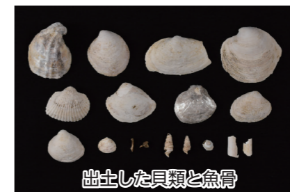
出土した貝類と魚骨

祈祷貝塚は、油ヶ淵東岸の碧海台地南東部に位置し、かつて縄文時代の遺物が採集されたといわれています。個人住宅の建設に伴い、発掘調査を行いました。