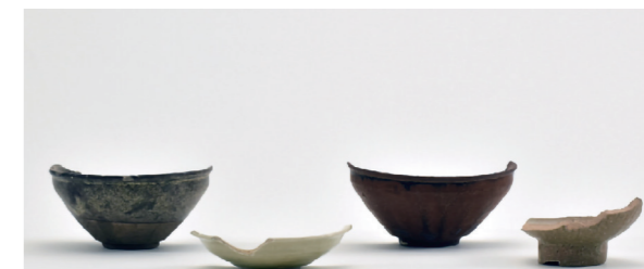
瀬戸・美濃産高級碗皿類と中国製青磁碗(右端)

調査区12の外堀から、戦国期の瀬戸・美濃地方で作られた高級陶器とともに中国製の青磁碗(明時代15世紀末~16世紀初頭)が出土しました。本證寺では、過去に中国製白磁小皿の小片が出土していますが、生産された時期がわかる中国青磁の出土は初めてです。当時の本證寺の姿を知る上で貴重な資料となりました。