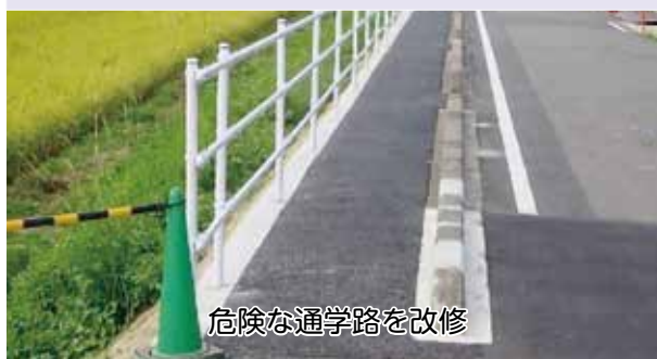
危険な通学路を改修