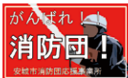
応援事業所ステッカー

会社員等として働きながら地域の安心・安全を守る活動を行っている消防団員を支援するため、消防団員に各種サービスを提供していただける事業所や販売店を募集しています。