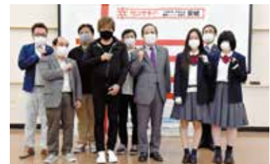
安城農林高校・ぼちぼちカフェ・安城市虹の家・工房げんせきの皆さん