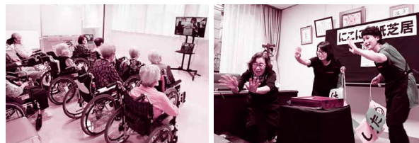
施設間をオンラインでつないで実施した紙芝居ボランティア