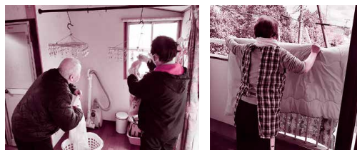
ホームヘルプサービス