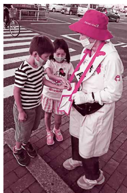
赤い羽根共同募金