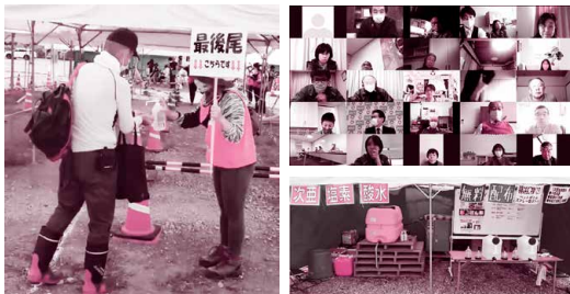
災害ボランティアオンライン研修