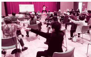
地域交流の場であるサロン活動