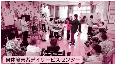
身体障害者デイサービスセンター