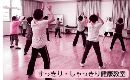
すっきり・しゃっきり健康教室