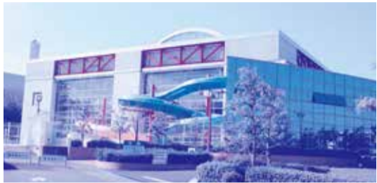
④マーメイドパレス 一年中遊べる温水プールです。造波プールやウォータースライダーもあります。