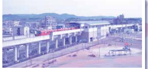
②名鉄西尾線 桜井駅 都市部へのアクセスに便利。あんくるバスの停留所もあります。駅前には多目的広場があり、様々なイベントが開催されます。