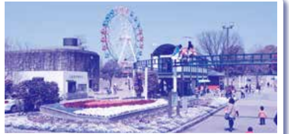
①堀内公園 観覧車、メリーゴーランド、ふわふわドームなど家族みんなで遊べます。