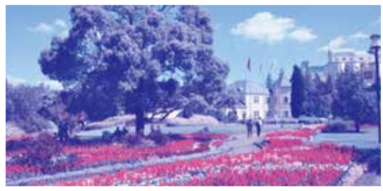
③デンパーク 花の大温室フローラルプレイスや木製大型遊具、室内遊び場あそぼーねなど、子供から大人まで1日ゆっくり遊べます。