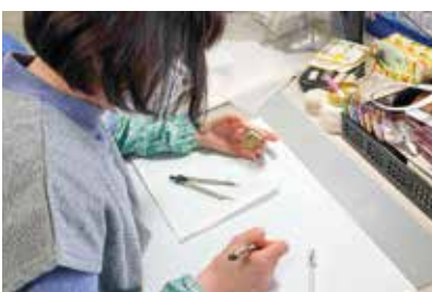
歴史の好きな人求む!