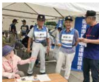
砺波市との防災訓練