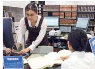
図書館で一緒に働きませんか