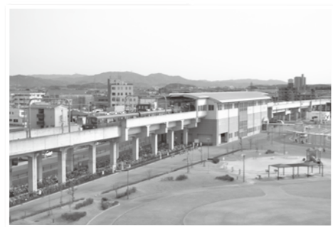
▲名鉄西尾線 桜井駅 都市部へのアクセスに便利。 あんくるバスの停留所もあります。 駅前には多目的広場があり、 様々なイベントが開催されています。