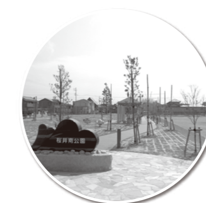
▲桜井南公園 楽しく遊べる複合遊具や広い グラウンドがあり家族で楽しめます。