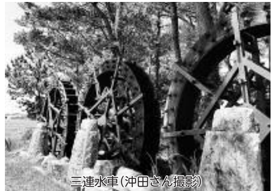
三連水車

今日はここで折り返しましたが、次は起点まで辿ってみたいものです。気候がいいときにでもまた挑戦してみようかな。