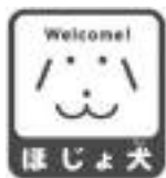
身体障害者 補助犬同伴 マーク 啓発

法の趣旨をご理解いただき、障害者が身体障害者補助犬を同伴する場合には、入店を断らず、気持ちよく利用できるよう心遣いをお願いします。身体障害者補助犬同伴に対し、理解ある社会をつくりましょう。