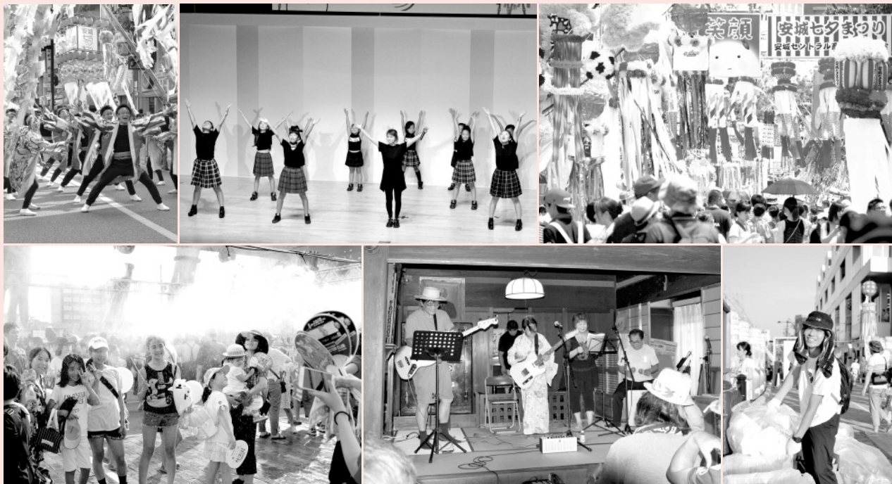
※写真は昨年のまつりの様子です。皆さんのアイデアあふれる事業をお待ちしています。

毎年100万人以上が訪れる、安城の夏の風物詩「安城七夕まつり」。今年は8月2日(金)～4日(日)に開催します。安城七夕まつり協賛会では、今年の七夕まつりを盛り上げる催し等を募集し、事業にかかる経費の一部を補助します。