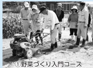
①野菜づくり入門コース