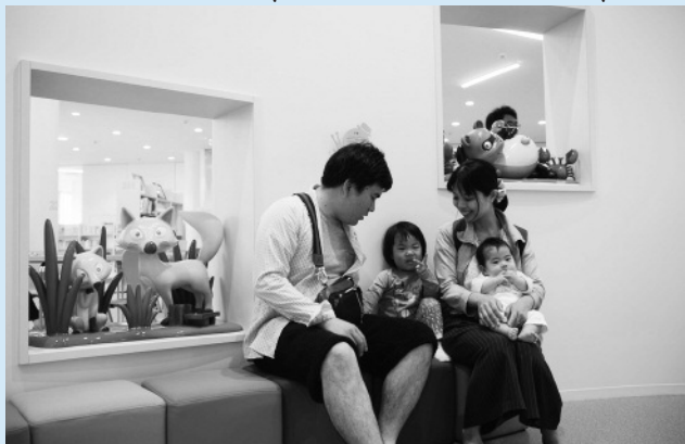
アンフォーレ内図書情報館 でんでんむしのへや (ご家族でのふれ合いの場としてご活用ください)

「三つ子の魂百まで」です。共通した楽しいひと時をつくるのが、生涯にわたる家族関係を決定づけるように感じます。今の若い保護者の皆さんはお忙しいのでしようが、できるだけ子どもに寄り添い、ふれあいの時間を大切にしてもらいたいと願っています。