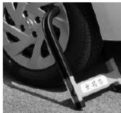
▲自動車の差押えの例(車を動かすことができなくなります)