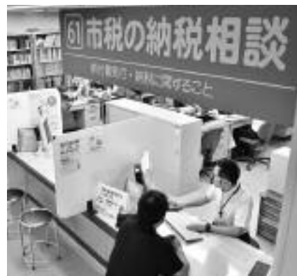
▲早めの相談をお待ちしています