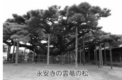
永安寺の雲竜の松