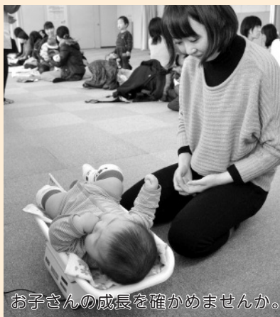
お子さんの成長を確かめませんか。

時10日(木)・24日(木)午前9時～11時 場仮設健診室 対4歳までの子とその家族等 申込期限→希望日前日まで(子の身長・体重計測のみの場合は予約不要)