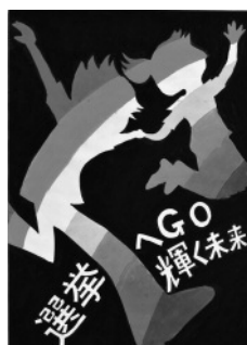
大須賀さんの作品