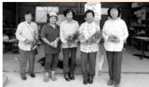
▲▲新田ふれあいクラブ のみなさんと野菜