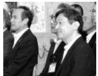
大変ご熱心に三河万歳を鑑賞されました

昼食後、皇太子さまには歴史博物館で三河万歳を鑑賞していただきました。まずは安城西中学校生徒による万歳が演じられ、次に三河万歳保存会による円熟（えんじゅく）の芸が披露されました。公演終了後、皇太子さまは演者全員にお声をかけられ、また会場に駆けつけてくれた安城東部小学校と丈山小学校の万歳クラブ員にも、丁寧にお声をかけてくださいました。そんな皇太子さまの横顔から、思いやりに満ちた細やかな気配りをされるお人柄が偲（おも）ばれました。