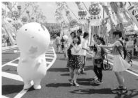
2015年 グランプリ作品

●応募作品 プリント4ツ切(ワイド可、デジカメ作品可、画像加工作品は不可)、一人5点まで ●申込 8月31日(木)までに直接か郵送(必着)で商工課(〒446-8501 住所記載不要)へ ※入賞作品は9月21日(木)〜23日(金)に文化センターで展示。表彰式は9月23日午後4時。