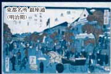
東都名所 銀座通 (明治期)