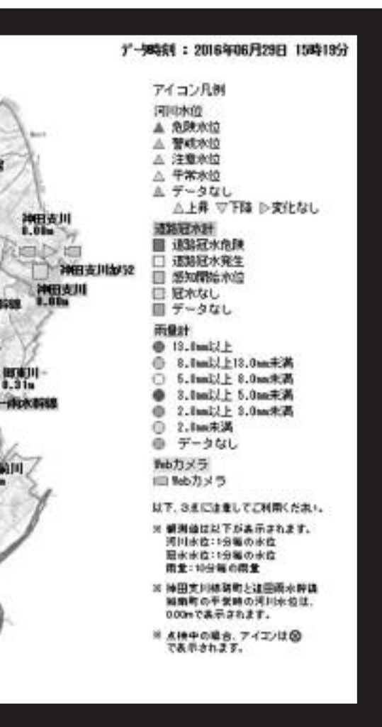
▲河川水位観測システムの画面

市では、大雨の際に情報を皆さんに発信するべく、平成28年4月から「河川水位観測システム」の運用を開始しました。