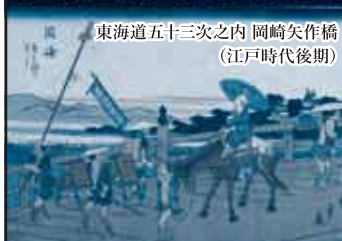
東海道五十三次之内 岡崎矢作橋 (江戸時代後期)