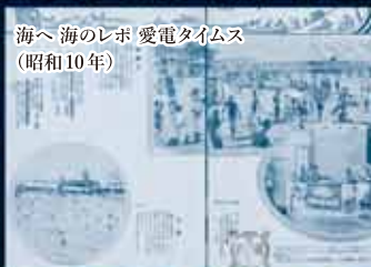
海へ 海のレボ 愛電タイムス (昭和10年)