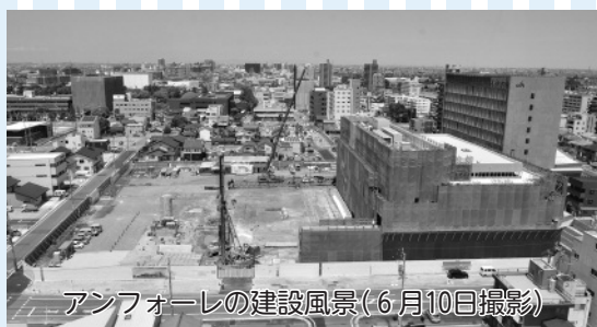
アンフォーレの建設風景(6月10日撮影)