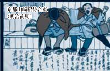
京都山崎駅待合室 (明治後期)