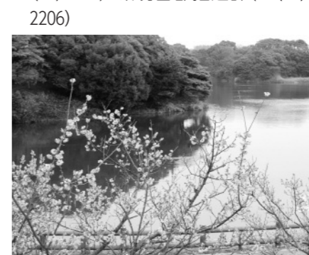
佐布里緑と花のふれあい公園

問 NPO法人エコネットあんじょう(☎(55)1315)、環境首都推進課(☎(71)2206)