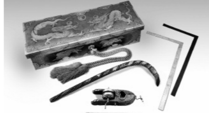
大工道具と箱(展示は2月28日(日)まで)