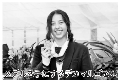
メダルを手にするデカマルゴさん