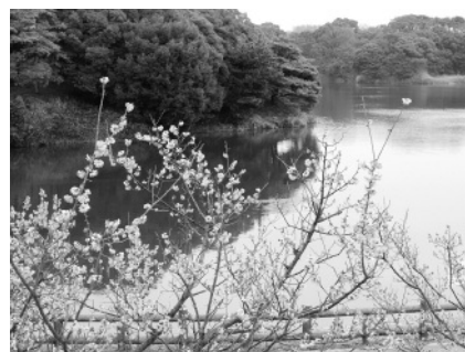
佐布里緑と花のふれあい公園

問 NPO法人エコネットあんじょう(☎(55)1315)、環境首都推進課(☎(71)2206)