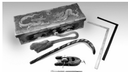
大工道具と箱(展示は2月28日(日)まで)