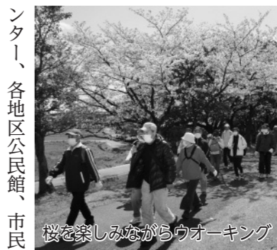
桜を楽しみながらウォーキング

楽しみながら歩きます 距離 ▼ 健脚コース ↓約9km ▼ ファミリーコース ↓約6km ● 申し込み 3月31日(火)までの午前9時～午後4時(月を除く)に、申込書を持参加送(消印有効)・ファクス・Eメール・電話で市体育協会(市体育館内/〒446-1006 1新田町新定山41-8/☎(75)3559/anjotalky08@ybh.ne.jp/☎(75)5182)へ ※当日会場でも受け付け可。 ● その他 申込書は市体育館、市スポーツセンター、文化セ