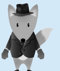
新美南吉童話 イメージキャラクター 「ごん吉くん」