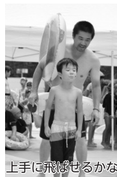
上手に飛ばせるかな