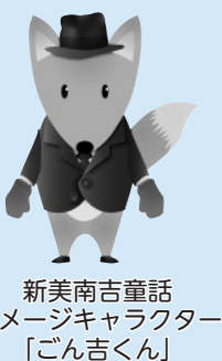
新美南吉童話 イメージキャラクター 「ごん吉くん」

本券1枚で2人まで入館できます。 ※中学生以下は無料。 有効期限：平成27年3月31日(火) ※休館日→(月)・第2(火)(祝の場合は翌日)、年末年始。 開館時間→午前9時30分～午後5時30分。