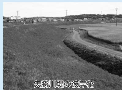
矢勝川堤の彼岸花