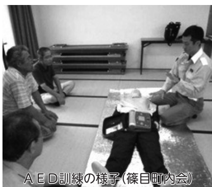
AED訓練の様子(篠目町内会)