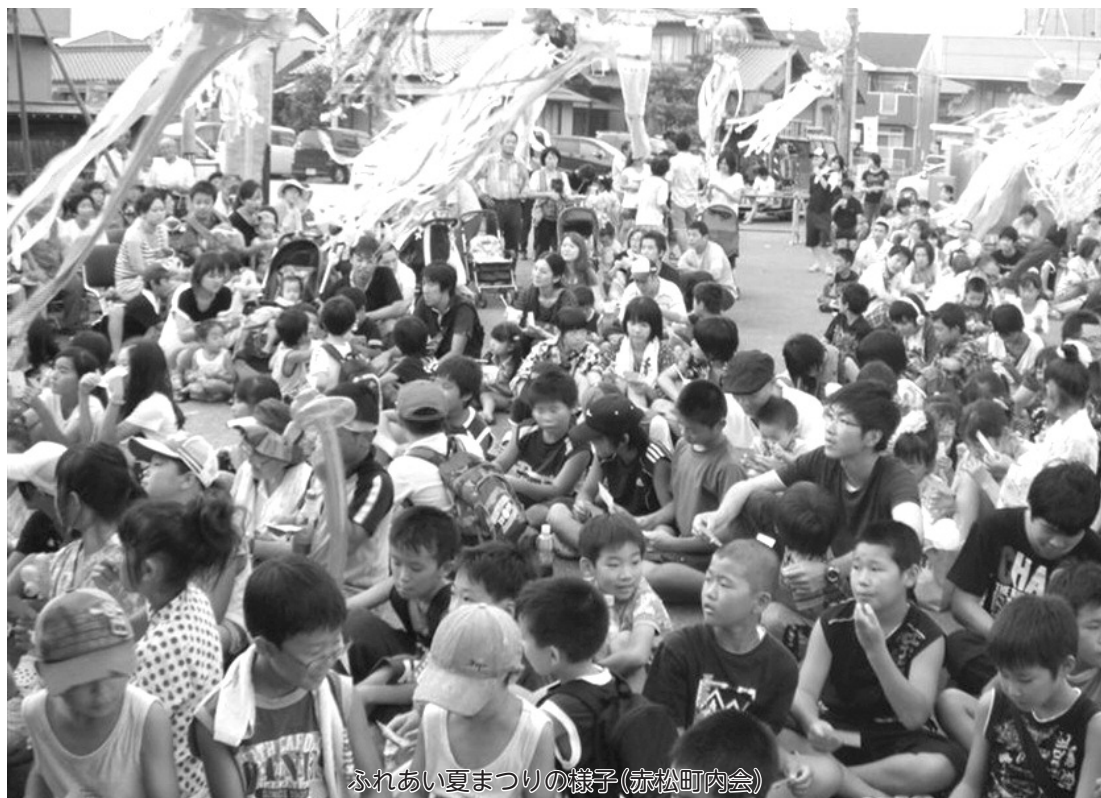
ふれあい夏まつりの様子(赤松町内会)