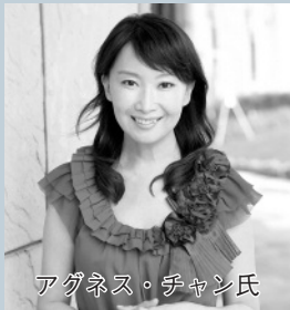
アグネス・チャン氏

● 10月13日(土)午後1時30分～3時30分 ● 市民会館 ● アグネス・チャン氏 ● 1000人(先着順。ただし、定員を超えた場合は、超えた日に届いたはがきのみ抽選) ● 託児(6カ月～6歳の未就学児／1人300円)、車椅子席あり ● 8月15日(火)～31日(金)に、往復はがき往信部裏面に申込代表者住所、氏名、電話番号、申し込み人数(1枚で2人まで)、託児・車椅子席の必要人数を、返信部表面に申込代表者の郵便番号、住所、氏名を記載し、市民協働課(〒446-8501住所記載不要／☎71)2218)へ