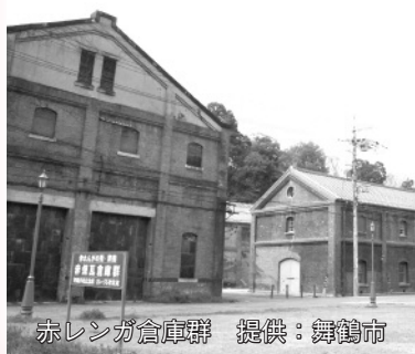
赤レンガ倉庫群

舞鶴は、東舞鶴と西舞鶴に分かれています。西は城下町。私が育った東は、明治時代に天然の良港として、海軍鎮守府が置かれ、軍港の町として大きな