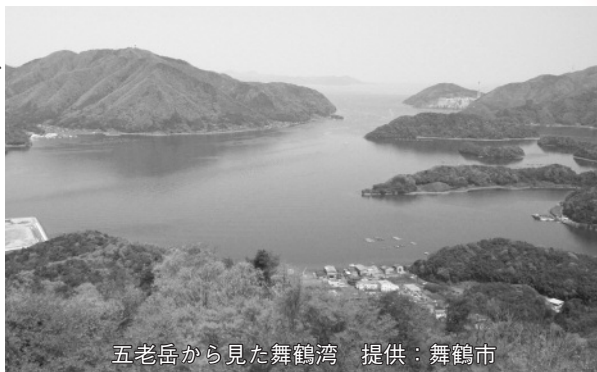
五老岳から見た舞鶴湾