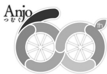
市制60周年ロゴマーク