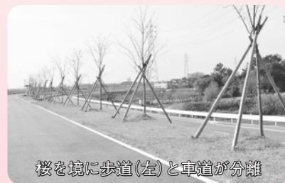
桜を境に歩道(左)と車道が分離

木戸町から藤井町の志貴野橋に かけて、矢作川堤1kmにわたり58 本の桜が植えられています。まだ 若木ですが、春に花が咲くのを楽 しみにしています。桜の木で車道 と歩道が分かれているため、まち の人が安心してジョギングやウー ーキング、犬の散歩などをしてい ます。また、途中7カ所にベンチ も設置されています。自然豊かで 穏やかな、とても住みやすいまち です。