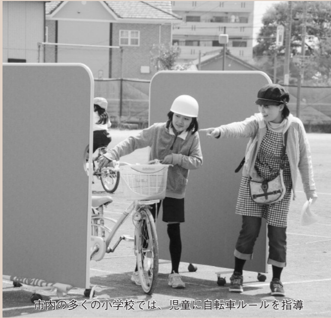
市内の多くの小学校では、児童に自転車ルールを指導