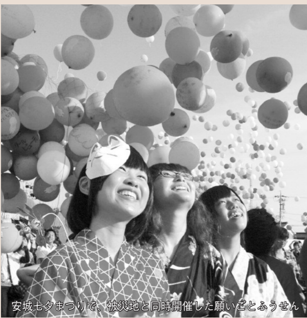
安城七夕まつりで、被災地と同時開催した願いごとふうせん

避難生活を送る方々の故郷復興の願いは、星空とともに国政へも届けられていると思います。被災者の皆さんの素朴な思いが、一日も早く実現することを、心より祈るばかりです。