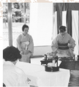
愛知県民茶会三河部

●とき 11月27日(日)午後1時30分 ●ところ 市民会館 ■問▼市民会館 (☎75)1151