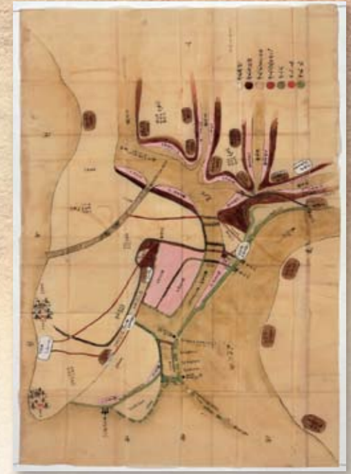
油ヶ淵排水路堤切絵図(享保9年(1724)頃)