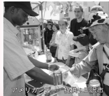
アメリカンデュー