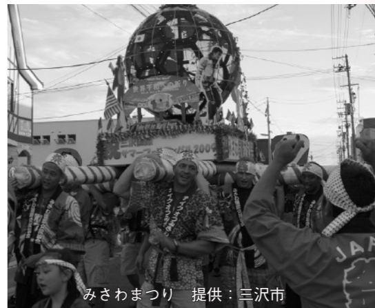
みさわまつり

リスマスイルミネーションを見たこと。バスの中から見学する機会に恵まれたのですが、そのころはまだ、日本で住宅のイルミネーションが流行する前でした。夜でも楽しげで美しい、アメリカのクリスマスに感動したものです。