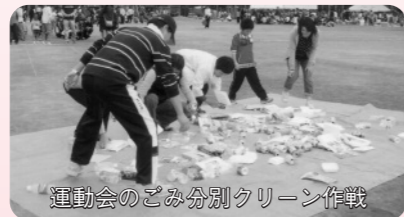
運動会のごみ分別クリーン作戦

ごみ減量20%の一環として、今年から町内運動会の競技の中に、ごみ分別理解向上を図るクリーン作戦を取り入れました。また、幼稚園児の太鼓演奏や男女別綱引きなどもあり、皆さん楽しんでいました。