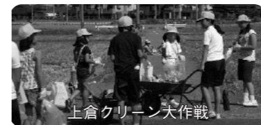
上倉クリーン大作戦

児童会が中心となって、「上倉クリーン大作戦」を実施。上倉用悪水を中心に、1年生から6年生まで、田畑の間にある用水や道路に落ちているごみを拾い、空き缶や車のタイヤ、ペットボトルなど、軽トラック2杯分のごみを集めました。そのかいあってか、地域の人たちも、散歩の途中にごみを拾ってくれるようになりました。これからも、きれいな環境にする活動を考えていきます。