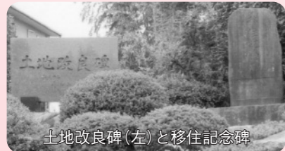
土地改良碑(左)と移住記念碑

明治用水の完成とともに多くの人々が移住し、苦勞して開墾しました。しかし、時代の変化とともに住宅が増え、新幹線三河安城駅もできました。市内でこれほど大きく変ぼうしたまちも少ないのではと思います。現在は、二本木町、緑町、美園町、二本木新町で「二本木連合町内会」を組織して活動しています。