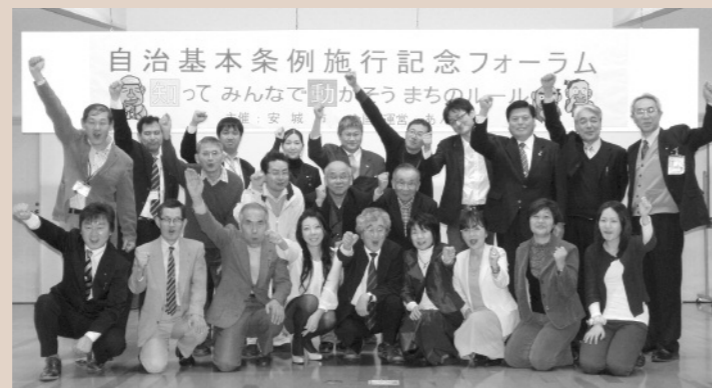
あんき会のみなさん