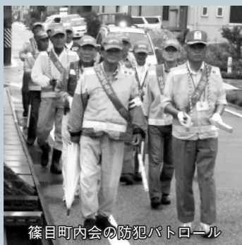
篠目町内会の防犯パトロール

たとえば町内会は、防犯パトロールや美化活動などを実施し、快適に暮らせる地域を住民一帯となって作りあげています。