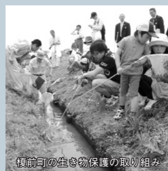
榎前町の生き物保護の取り組み

みなさんも、コミュニティに積極的に参加して、暮らしやすいまちづくりをしましょう。