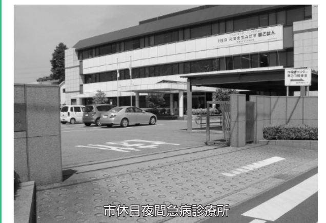
市休日夜間急病診療所