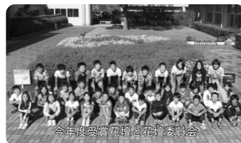
今年度受賞花壇と花壇委員会

同校は、東海7県の小学校が花壇の美しさなどを競う、フラワー・ブラボー・コンクールという大会の強豪校。毎回上位入賞し、大賞も受賞したことがあるほど。花壇のデザインから世話まで、子どもが中心となって取り組みます。こだわりは、市の花であるサルビアを積極的に使うこと。