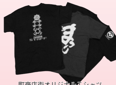
町商店街オリジナルTシャツ

楽の街」として、夜遅くまで人通りの多いところでした。町内に2つの映画館があり、いろいろな飲食店も軒を連ねていたのです。今、その面影はほとんど見られませんが、代わりに安城南明治土地区画整理事業によって、新しい街づくりの計画が始まろうとしています。町民と行政が協力して、末広町を再びにぎわいと活気にあふれる街にしようと、一生懸命取り組んでいます。