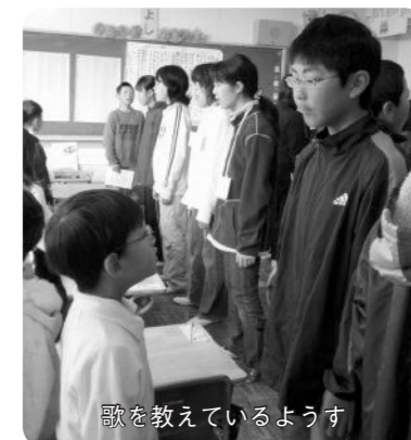
歌を教えているようす

子どもたちの歌唱力がとても高いです。その秘けつは、上級生が下級生に教えるというスタイル。口の開け方から声の出し方まで、5・6年生が、1・2年生の教室に向いて指導します。毎月の歌も、合唱曲の中から選ばれ、徐々にレベルが上がるといったような選曲をしています。