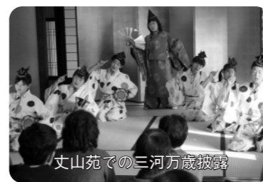
丈山苑での三河万歳披露