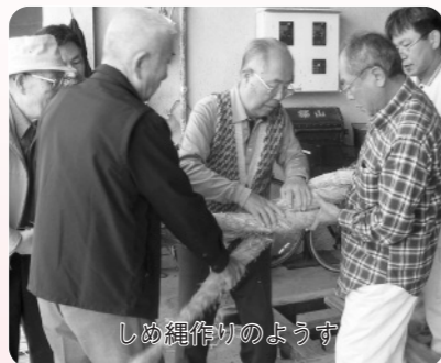
しめ縄作りのようす

まず、末廣秋葉神社の祭礼があります。毎年11月の吉日に、災害厄除けを祈願して、盛大にとりおこないます。神社に飾る「しめ縄」は、町内の長老や経験者の指導を受けながら、伝統的に町民の手で