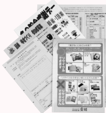
パンフレット、コピー紙