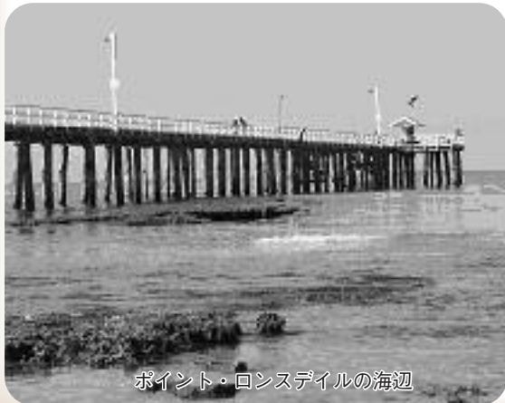
ポイント・ロンズデイルの海辺

わたしはポイント・ロンズデイルというホブソンズベイ市からおよそ90km離れた人口わずか3500人の小さな町に住んでいます。市役所の同僚たちと車で片道約1時間15分かけて通勤しています。わたしの町はメルボルン市近郊の人々の別荘が海岸付近に並び、また休日にキャンプを楽しむ人たちのためのキャラバンパークがあるリゾート地域です。