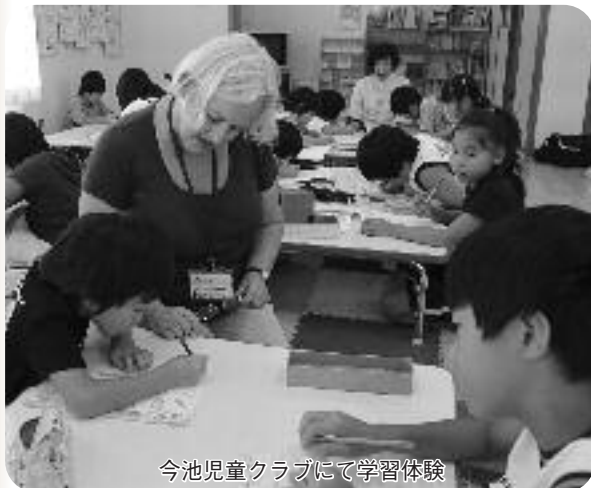
今池児童クラブにて学習体験