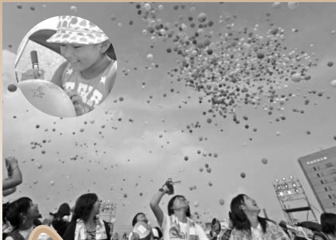
天まで届け！願い事風船