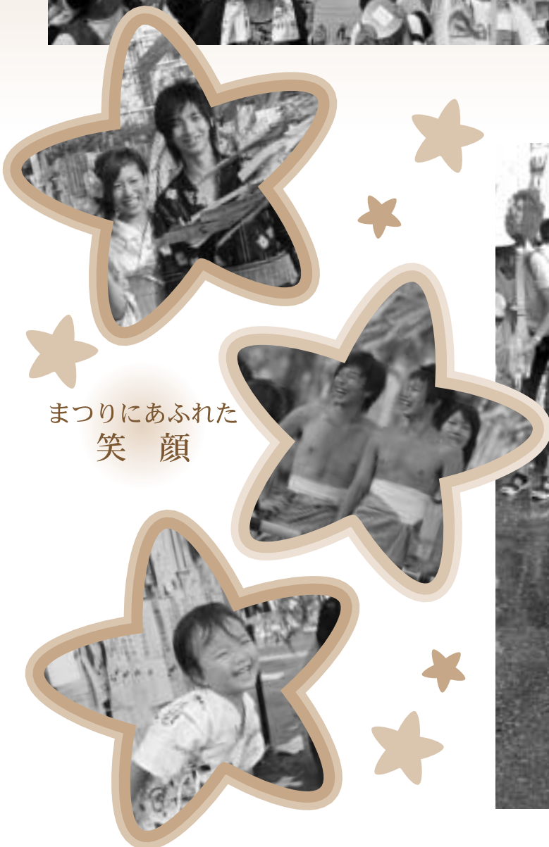
まつりにあふれた 笑顔