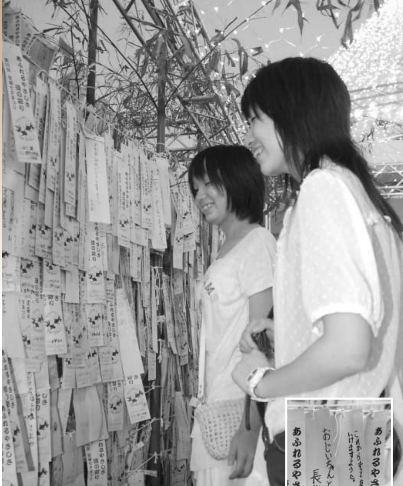
七夕といえば短冊。 願いを書いて 短冊ロードへ。