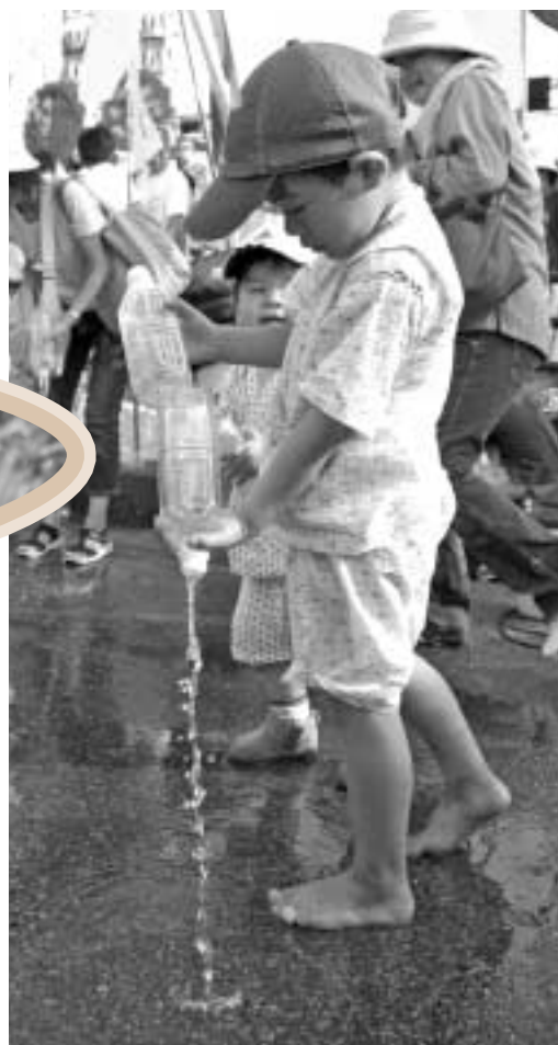
まちを冷やせ！打ち水大作戦