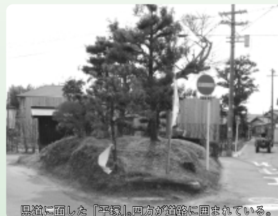
県道に面した「平塚」。四方が道路に囲まれている。

「地元では、この塚の名前を平塚と呼んでいます。いつからどうという理由で存在しているのか、詳しいことはわかりませんが、昔から大事にしないといけ