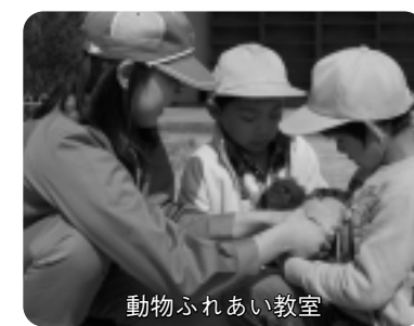
動物ふれあい教室

らに手作り木工品を販売しています。ときには、販売開始の2時間前から長蛇の列ができることも。安心して新鮮な食材をお求めの人には必見です。安城農林高校は、優秀な農業の後継者を育成するとともに、活動を通して、多くの人に「食の大切さ」を考えてもらう機会を提供し続けています。