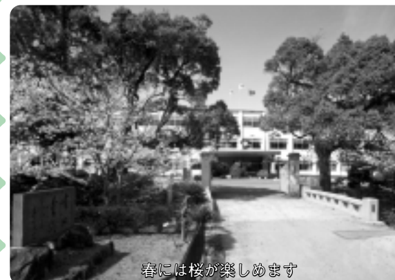
春には桜が楽しめます

学校を紹介するスクールナビ。第1回は、安城農林高校です。明治34年に開校した同校には、旺盛な開拓者魂と勤労を旨とする実学の精神が脈々と息づいています。県内の農業高校の中では最多の6学科があり、愛知県の代表的な農業高校といえます。今回は、同校の特色でもある「地域に貢献する取り組み」に