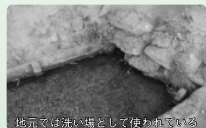
地元では洗い場として使われている

地元で「ヤキアゲ」と呼んでいる水場です。こんこんと水がわいてきます。この水は、飲んでもよさそうなほどきれいに透き通っていますが、飲料とするのはやめておいた方がいいとのことでした。