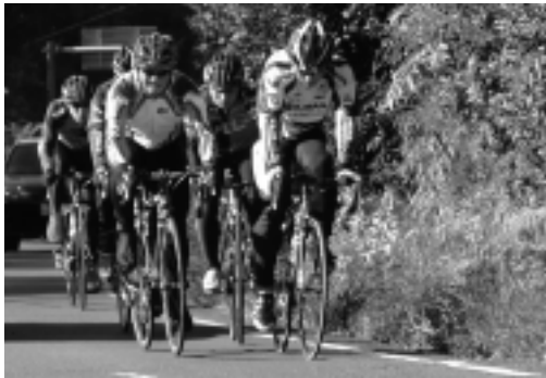
問い合わせ▼ 体育課(市体育館内) ☎(75)3535

■ 優秀団体 アイシン・エイ・ダブリュ(株)(水泳) 科学技術学園高校刈谷ソフトテニス部・バレーボール部・サッカー部 安城ジュニア陸上クラブ6年男子リレーチーム・6年女子リレーチーム・5年混合リレーチーム