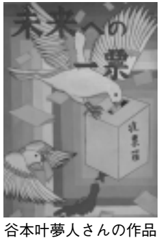
谷本叶夢人さんの作品