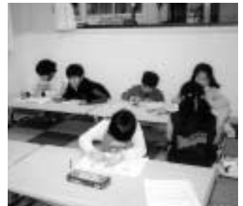
児童クラブの子どもたち (写真は錦町児童クラブ)