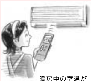
暖房中の室温が20度を超えないようにこまめに調整しましょう

毎月1日は、 省エネの日 。また、特に、暖房器具などの使用によって家庭でのエネルギー消費が多くなる 2月 は、「 省エネルギー月間 」になっています。家庭での小さな工夫の積み重ねが大きな省エネにつながります。わたしたち一人ひとりのちょっとした心がけで地球環境を守っていきましょう。