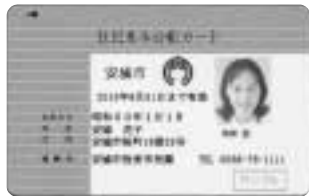
Bバージョン（デザインは若干変更になります）

住基カードには、Aバージョン（顔写真なし）とBバージョン（顔写真付き）の2種類があり、申請時に選択できます。顔写真付きの住基カードは、公的身分証明として利用することができ、また、運転免許証やパスポートなどの身分証明をお持ちでない人には便利です。