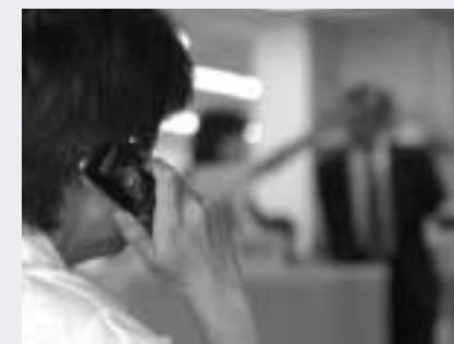
周りの迷惑、考えてますか？

⑪ 電話とともにモラル・マナーの携帯を たくさんの人が持つようになった携帯電話。いつでもどこにでも持ち運びができ、多機能化によりますます便利になった反面、いたずらや犯罪に利用されることも。また、マナーを無視した利用者も目立つようになってきました。 ときと場所をわきまえて利用するのが最低限のマナーです。静かな場所で、突然大きな声で話し始める会社員。駅の階段に腰をかけたり、通路に立ち止まったりして長時間メールを打ち続ける高校生。迷惑行為であることがわからないはずがありません。また、映画館、図書館、美術館などではお互いに静かな雰囲気を楽しむため、電源を切ります。 あなたは、電話をかけながら、またメールを打ちながら車を運転していませんか。電話に意識が傾いてしまい、運転に集中できないばかりか、片手運転では、とっさの危険回避ができせん。しばしば、携帯電話に視線を落としている時間の方が、前方を見ている時間よりも長い人を見かけます。電話をしながら運転