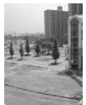
三河安城駅側から北東方向を望む。ロータリー周辺にはマンションが建ち並ぶ

● 受付期間 9月5日(金)～10月31日(金)(土・日曜日、祝日を除く) 午前9時～午後5時 ● 受付場所 市街地整備課 ● 売却地 安城新幹線駅周辺土地区画整理事業第15街区第1、2、3、4号画地／商業地域、容積率400%、建ぺい率80%、準防火地域、地区計画区域、指導要綱区域 ● 売却条件 ①画地を1つの敷地として利用する ②1階及び2階部分を店舗または事務所とする ③地区計画及び指導要綱を遵守する ④換地処分時の清算金については購入者の負担とする ● 売却価格 3億4027万7000円(16万2600円/㎡) ● 提出書類 簡単な計画平面図、簡単な計画立面図(またはイメージパース)、概略建築物計画書(建築物概要書、テナント計画書、資金計画書) ● 選考方法 提出書類を審査し、その結果、最もまちづくりに対する貢献度(駅前の顔となり、にぎわいと経済活動をもたらすことなど)が高いと評価された建築物計画を提出した人を当選者としてます ※評価基準については、応募要領を参照してください。なお、当選者がいない場合は再募集します。 問い合わせ▼市街地整備課